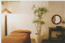
QUANON ASHIYA 兵庫県芦屋市西山町11-8 TEL : 0797-38-4414 http://www.quanon.jp/